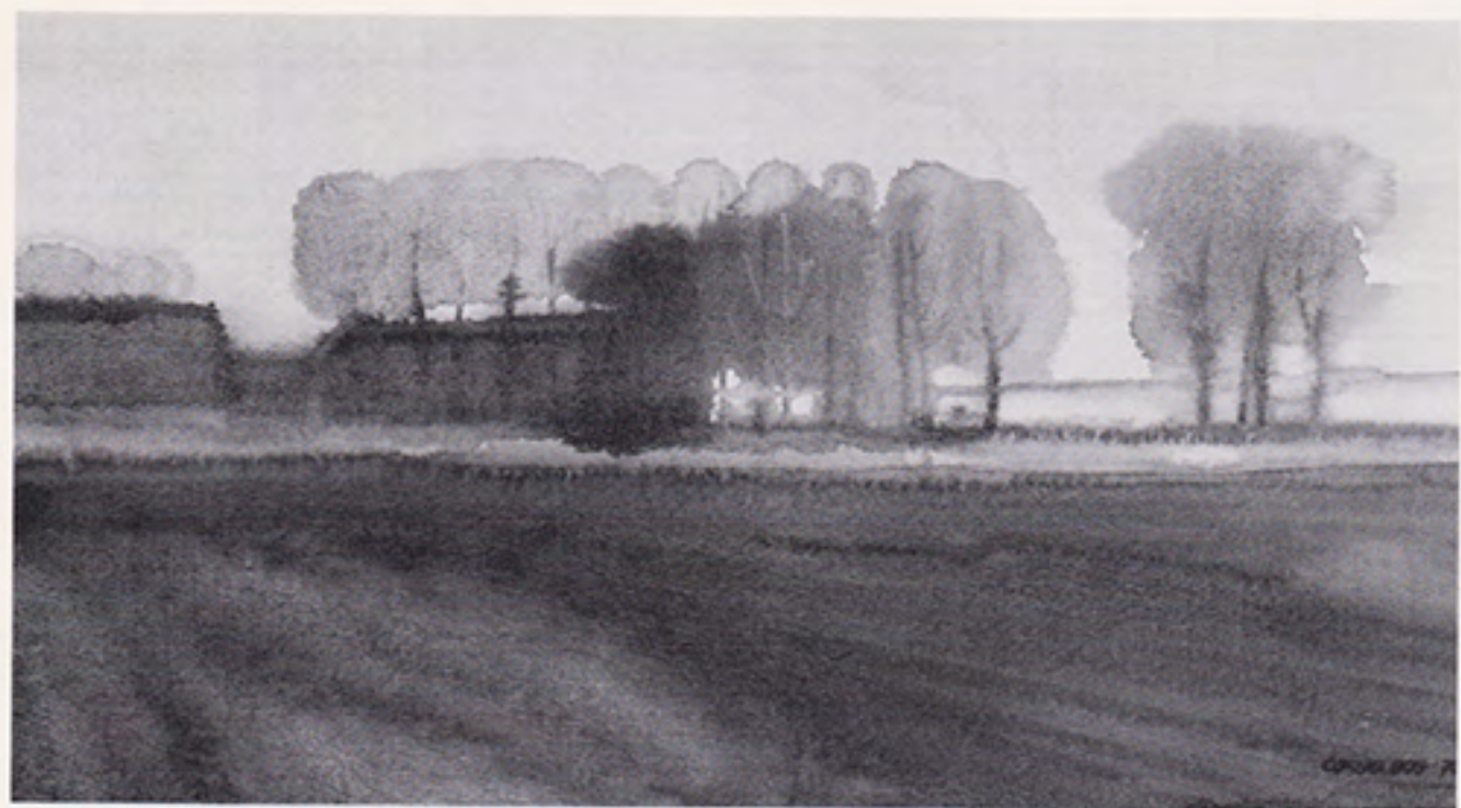
Gronings landschap 1978