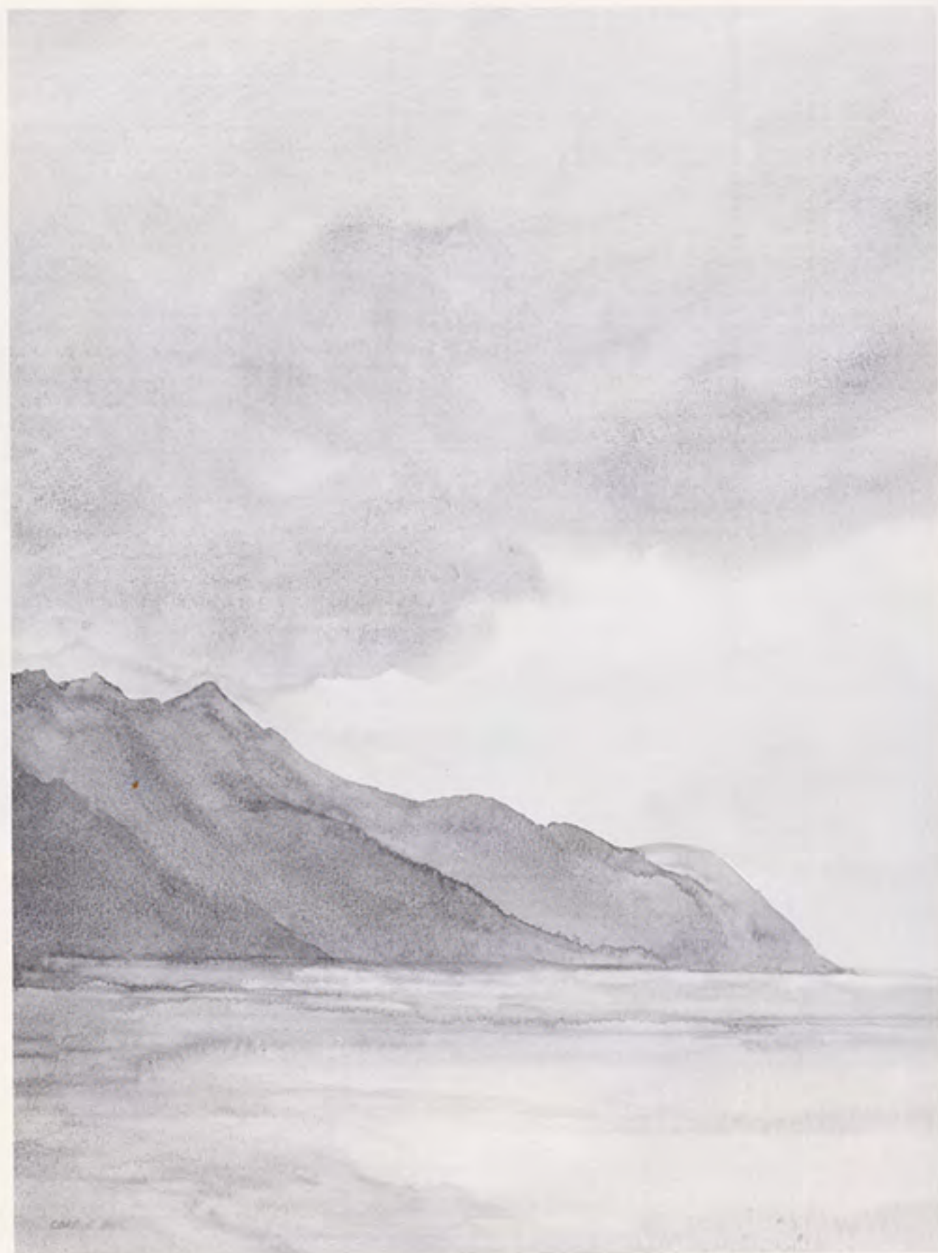
Meer van Genève 1990