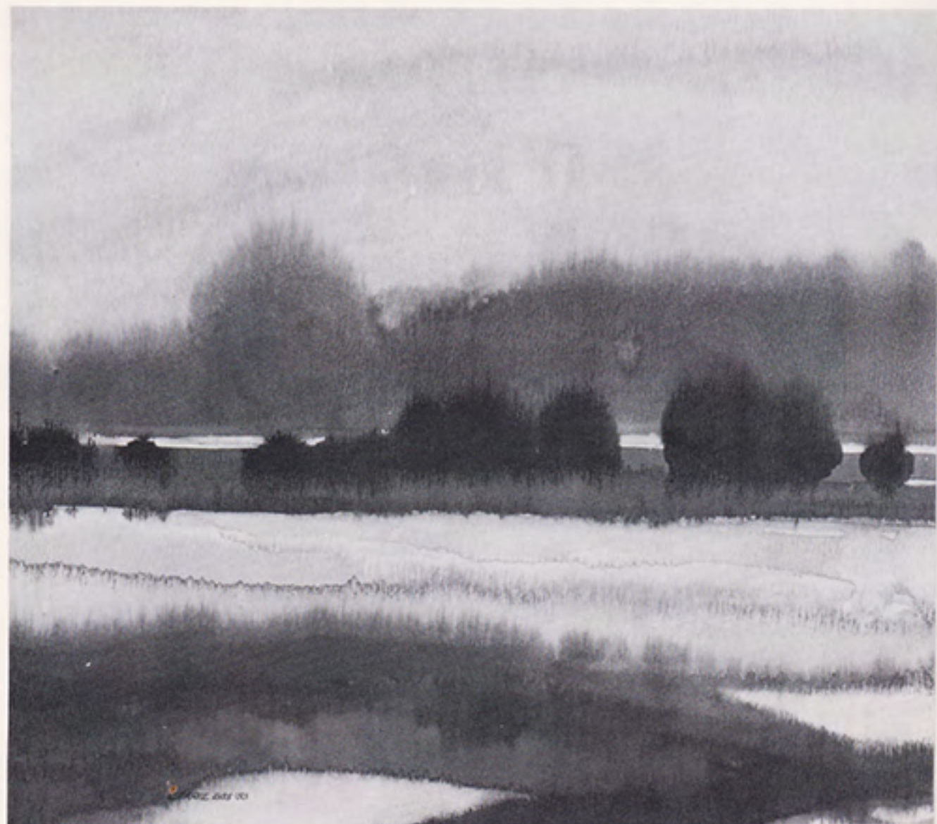
Rivier de Rijn 1983