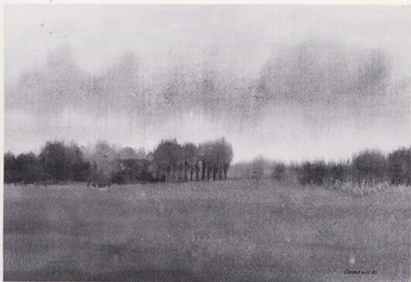
Gronings landschap 1981